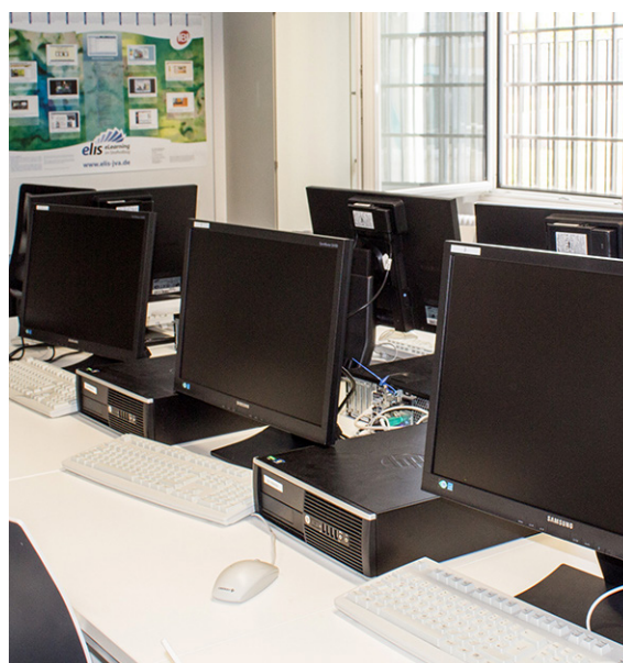
Abb. 2: Ein elis -Schulungsraum

Der Einsatz der elis -Lernplattform in Österreich unterscheidet sich etwas von der in Deutschland. In Deutschland wird elis vornehmlich im Schulunterricht genutzt. In Österreich begleiten oftmals SozialpädagogInnen und BeamtenInnen der Justizwache die Nutzung der Plattform. Diese Nutzung bezieht sich daher überwiegend auf Selbstlernphasen und die betreute Freizeit. Hier kommen etwa freigeschaltete Internetseiten, die sich mit der Jobsuche oder dem Bewerbungsschreiben befassen, zum Einsatz,