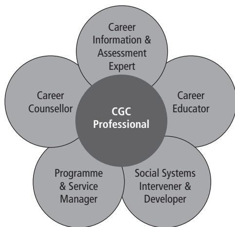
Abb. 1: Die NICE Berufsrollen

Grad ihrer Einbindung in die Kernprozesse der Bildungs- und Berufsberatung widerspiegelt. Bildungs- und BerufsberaterInnen übernehmen in ihrer Zusammenarbeit mit den KlientInnen je nach deren individuellen Bedürfnissen und dem Status quo im Prozess der Lösungsfindung unterschiedliche Rollen mit den Schwerpunkten: Beratung, Pädagogik, Diagnostik und Information, Management, Intervention in soziale Systeme. Alle diese Rollen erfordern eine übergreifende Professionalität.