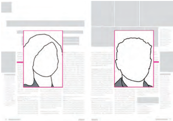
Abb. 3: Frauen rücken ins Bild