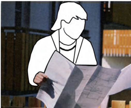
Abb. 4: „Neue“ Frauenrollen darstellen – und damit einen (weiteren) Teil der gesellschaftlichen Realität abbilden

Wenn Bilder als Illustrationen für konkrete Tätigkeiten ausgewählt werden, ist bei der Auswahl besonders darauf zu achten, dass nicht gängige Geschlechterzuschreibungen wiederholt und reproduziert werden.