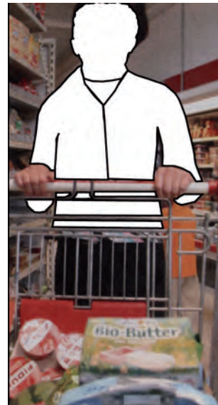
Abb. 5: „Neue“ Männerrollen darstellen – und damit einen (weiteren) Teil der gesellschaftlichen Realität abbilden