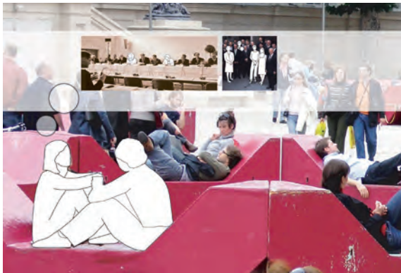
Abb. 1: Blickpunkt Gender

Die Handreichung „Blickpunkt Gender. Leitfaden zur Mediengestaltung“ (siehe Knoll/Szalai 2007) richtet sich an jene Menschen, die mit der Erstellung von Medien im weitesten Sinne zu den Themen Umwelt sowie Nachhaltige Entwicklung zu tun haben – vom Verfassen eines Artikels oder einer Pressemeldung bis hin zur Gestaltung einer Zeitschrift oder eines Folders. Der Leitfaden unterstützt mit umsetzungsorientierten Beispielen und praktischen Tipps bei der gendersensiblen Gestaltung sowie bei geschlechtergerechter sprachlicher und bildlicher Darstellung in den Medien.